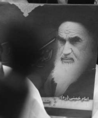
امام خمینی (ره):

لَمْ يَمُنْ سِوَاكَ اللَّهُمَّ حَامِلَةُ حُرَاي مدرسه علمیه فاطمیة پیشوا