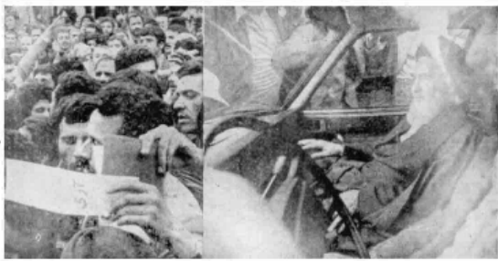
تعداد مردم در مراسم تشکیل امام خمینی و سران حکومت مسیحی در تهران و دیگر نقاط کشور در طی کشور به ده ها تن رسید از سوی ملیونهارای و مکتب ری که خود را توسط حمایت و دعوتی خود را با نام توحید فرستادند اعلام کردند